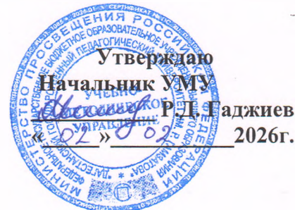
График 1-ой ликвидации задолженностей по итогам промежуточной аттестации (зимней зачетно-экзаменационной сессии) студентов 4 курса очной формы обучения направление подготовки 44.03.04 – Профессиональное обучение (по отраслям), Направленность/Профиль «Право и правоохранительная деятельность» факультета управления и права 2025-2026 учебного года