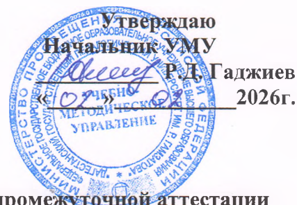
График 1-ой ликвидации задолженностей по итогам промежуточной аттестации (зимней зачетно-экзаменационной сессии) студентов 2 курса очной формы обучения направление подготовки 44.03.05- Педагогическое образование (с двумя профилями подготовки), Направленность/Профили: «Право» и «Обществознание» факультета управления и права 2025-2026 учебного года