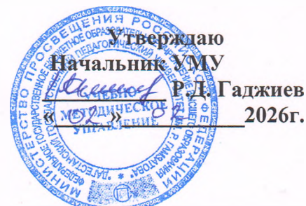
График 1-ой ликвидации задолженностей по итогам промежуточной аттестации (зимней зачетно-экзаменационной сессии) студентов 3 курса очной формы обучения направление подготовки 44.03.04 – Профессиональное обучение (по отраслям), Направленность/Профиль «Право и правоохранительная деятельность» факультета управления и права 2025-2026 учебного года